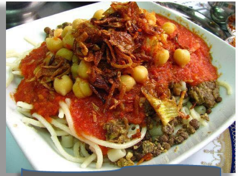
エジプトの国民食コシャリ

エジプトの大学(観光学部)を卒業し、10年間観光業に従事する。世界青年の船に参加したのをきっかけに日本の教育制度に興味を持ち、現在は県内小学校にて英語を教える傍ら、県内各地でエジプト文化や、ハラールについて公演活動をおこなっている。